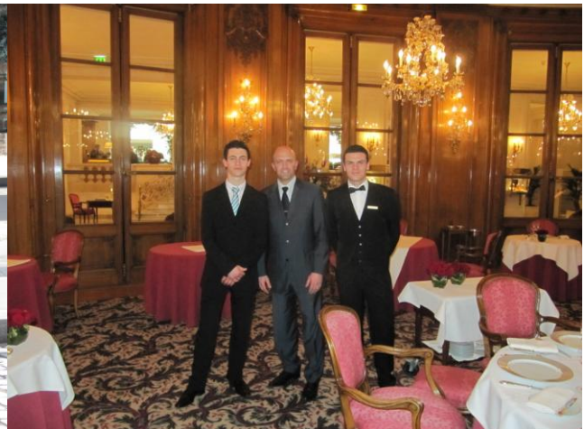
Dans les salons du BRISTOL PARIS